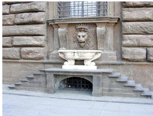
Fronte palazzo Pitti

E ne manca ancora qualcuna..... tanto il parco è gratis;)